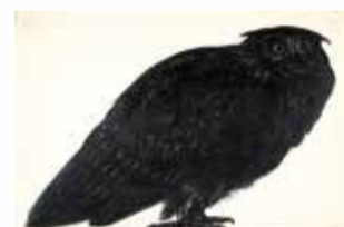
Georges Dorignac, Chouette , s.d.

Avec cette carte, tu vas pouvoir explorer l'exposition, trouve les :