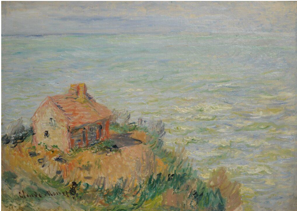
Claude Monet, La Cabane des douaniers, effet d'après-midi , 1882, huile sur toile, Musées nationaux, Paris © RMN-Grand Palais (Musée d'Orsay), dépôt au musée national des Douanes, Bordeaux

Au XIX e siècle, des cabanes permettent de surveiller la circulation des navires sur le littoral et abritent les douaniers en cas de mauvais temps. Très bien intégrées au paysage, elles ont attiré l'intérêt de nombreux peintres dont Claude Monet.