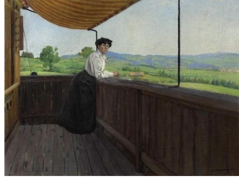
Félix Vallotton, Sur le balcon , 1905, huile sur toile, collection particulière