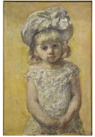
Mary Cassatt, Portrait de fillette - La robe de dentelle , 1879, huile sur toile, Bordeaux, MusBA