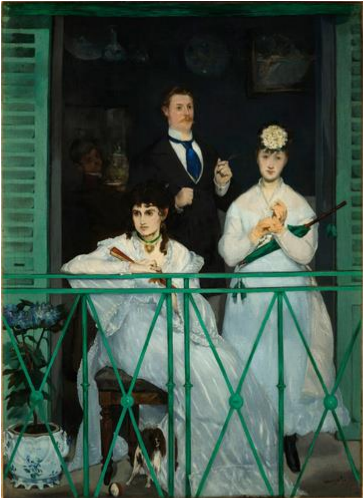
Edouard Manet, Le Balcon , entre 1868 et 1869, huile sur toile, H. 170 ; L. 125 cm, Legs Gustave Caillebotte, 1894