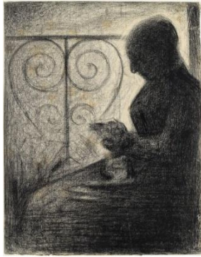
Georges Seurat, Devant le balcon , Date indéterminée, Crayon Conté sur papier blanc, Paris, musée du Louvre