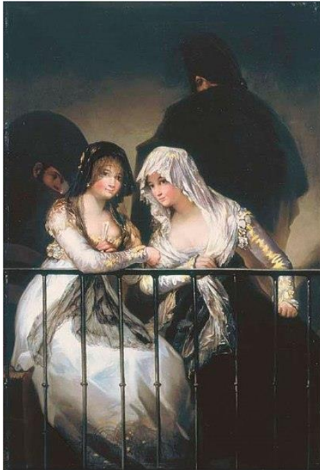
Francisco de Goya, Les Majas au balcon , 1800-1803, huile sur toile, collection particulière

Les trois personnages représentés semblent perdus dans leurs rêves. Les couleurs choisies sont très vives : la balustrade et les persiennes vertes, la cravate bleue de l'homme debout. Elles contrastent avec les robes blanches des femmes et la pénombre de l'arrière-plan. Cette scène de balcon est très probablement influencée par les Majas au balcon du célèbre artiste espagnol Francisco de Goya (1764-1828).