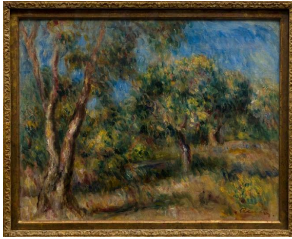
Auguste Renoir, Paysage de Cagnes , vers 1915, huile sur toile, Bordeaux, MusBA