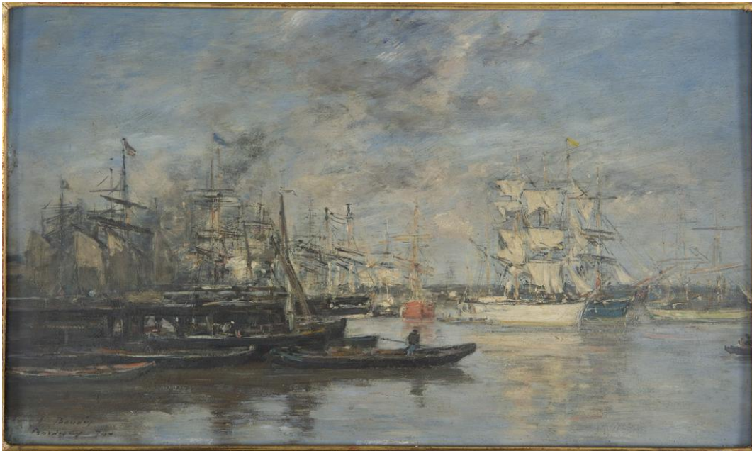
Eugène Boudin, Bordeaux. Le voilier blanc. Effet du soir , 1874, huile sur bois (panneau), Bordeaux, MusBA

Né à Paris, Claude Monet (1840-1926) grandit en Normandie dans la ville du Havre. Il s'initie à la représentation de la nature en peintre au contact du peintre Eugène Boudin, qui a peint en 1874, l'année même de la première exposition impressionniste, le Port de Bordeaux qui appartient au Musée d'Orsay ainsi que Bordeaux. Le voilier blanc. Effet du soir qui fait partie des collections du MusBA.