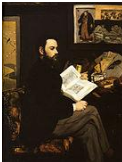
Édouard Manet, Portrait d'Emile Zola , 1868, huile sur toile, Paris, Musée d'Orsay