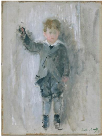
Berthe Morisot Le neveu de Berthe Morisot , 1876, huile sur toile, Bordeaux MusBA