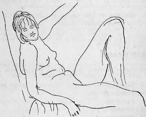
Nu , par Augustus JOHN, dessin original (voir n° 81)