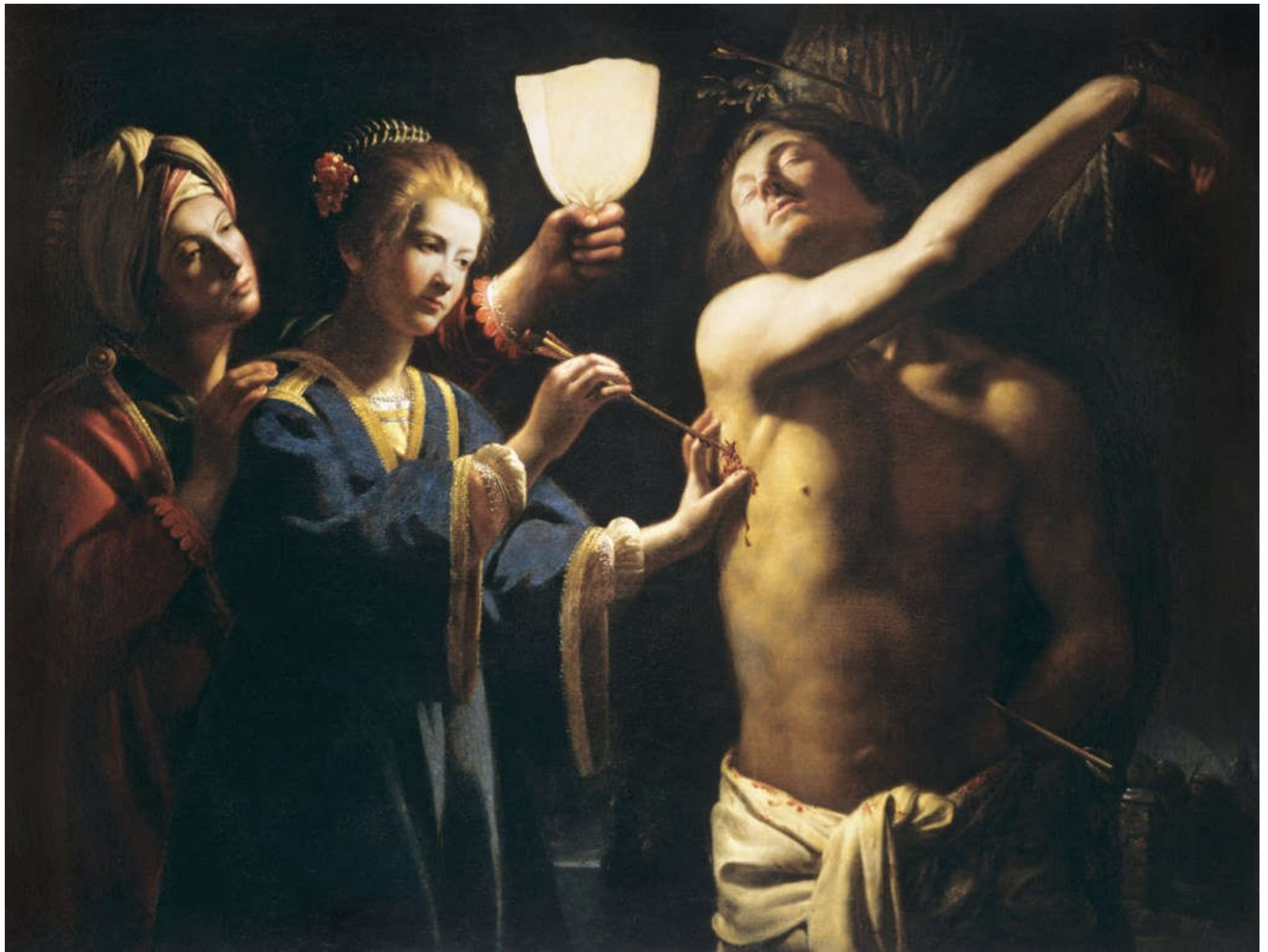
Le maître à la chandelle, Saint Sébastien soigné par Irène , XVII ème siècle, Huile sur toile