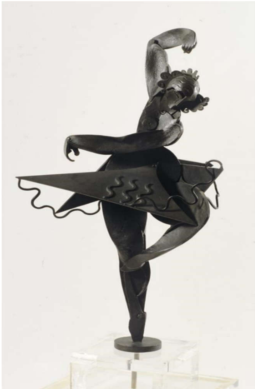
Pablo Gargallo, Danseuse , 1925, Ronde-bosse, cuivre patiné