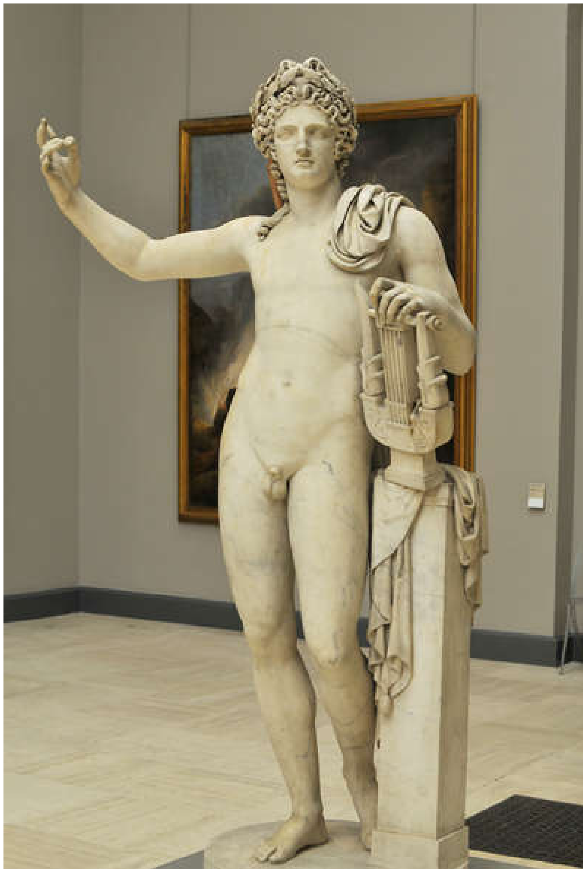
François Frédéric Lemot, Jean-Pierre Cortot, Apollon , Ronde-bosse en marbre, 1812 ; 1827

Lexique: Apollon - un dieu grec - la musique - la poésie - la couronne de laurier - le corps nu - le drap froissé - le bras levé - la lyre - le marbre blanc - la colonne - le socle.