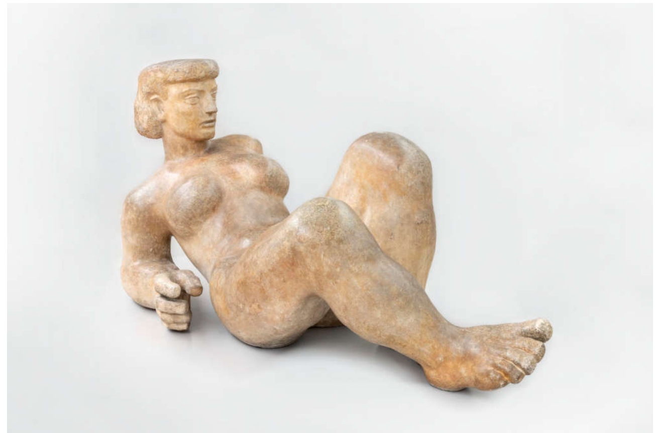
Joseph Rivière, Figure au bord de l'eau pour la Piscine Municipale d'Albi , 1951, Plâtre original

Contextes de création : La sculpture de l'homme est « un gisant », il devait orner un monument aux maquisards fusillés près de la Bresse. La figure au bord de l'eau qui est en plâtre a été reproduite en pierre et installée près de la piscine d'Albi.