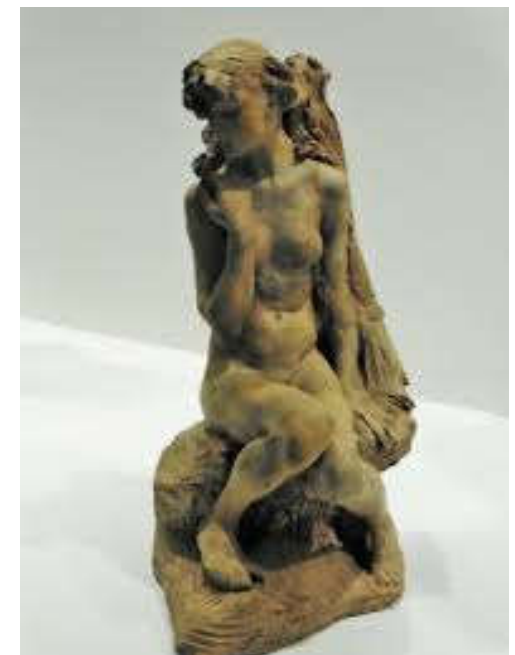
Camille Claudel, jeune fille à la gerbe , 1886, Terre cuite