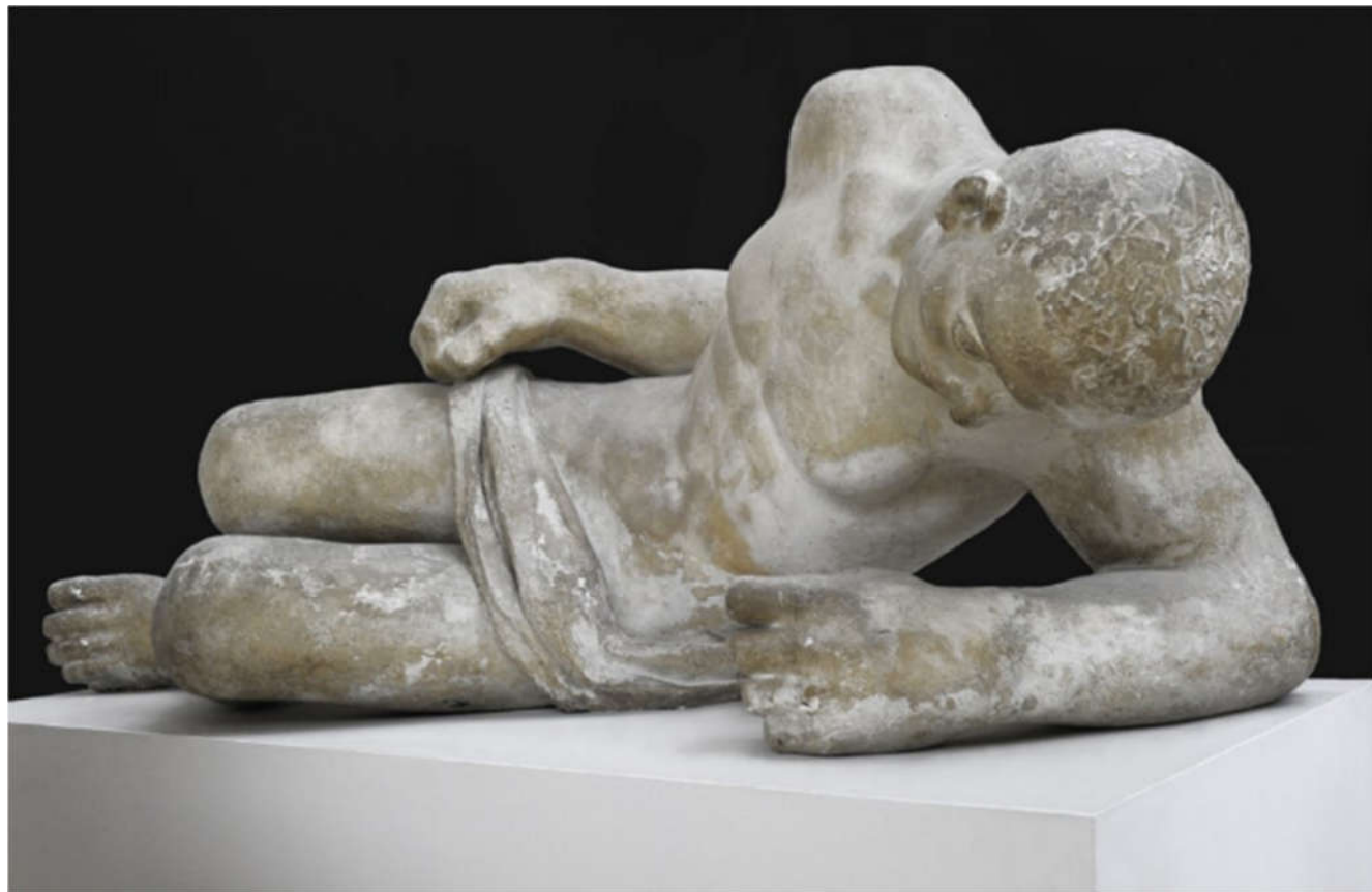
Joseph Rivière, Gisant , 1949, Plâtre patiné