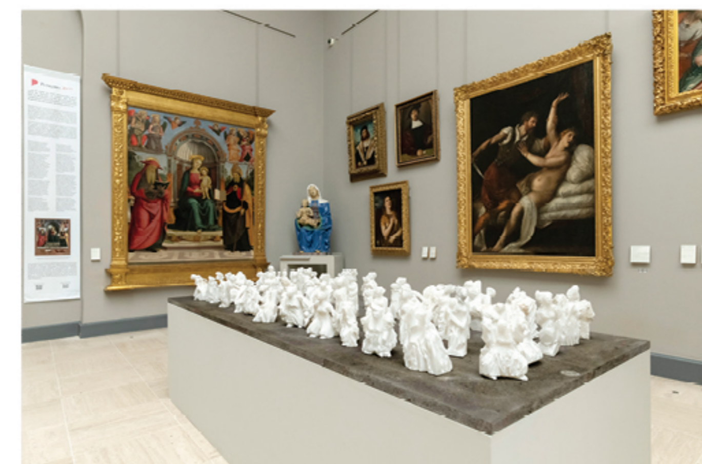
→ Le Bal des Mexicaines , 2020 albâtre et lave de Chambois