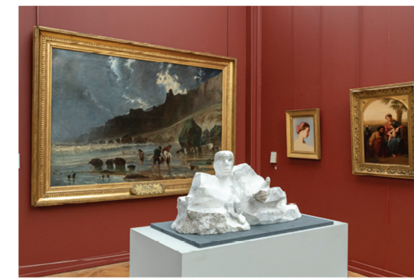
→ Sardanapale , 2020 albâtre