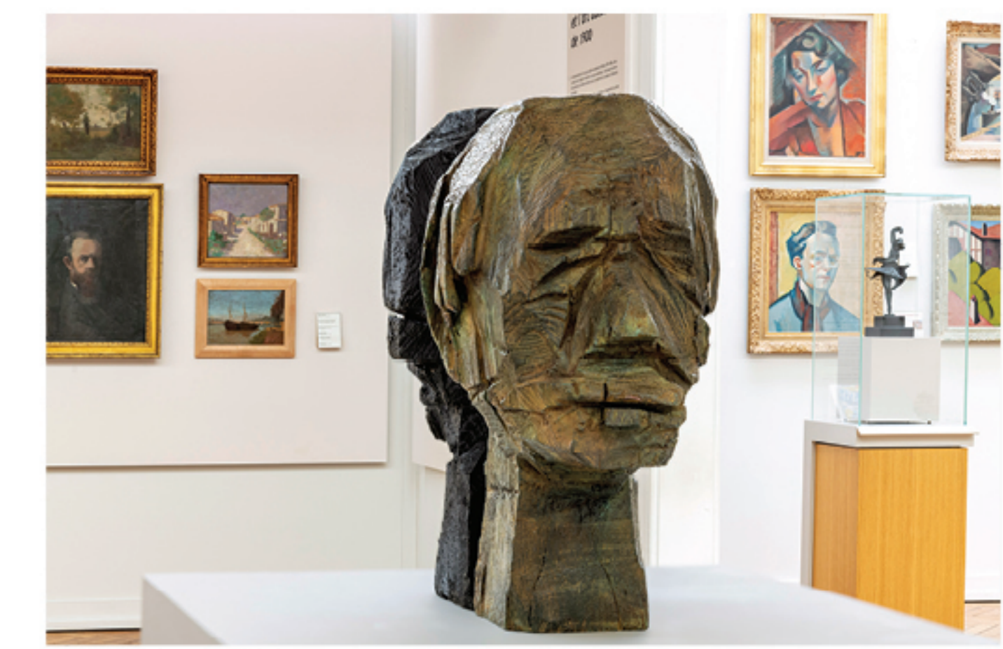
→ Clemenceau , 2021, bois et bronze tiré de son original en bois