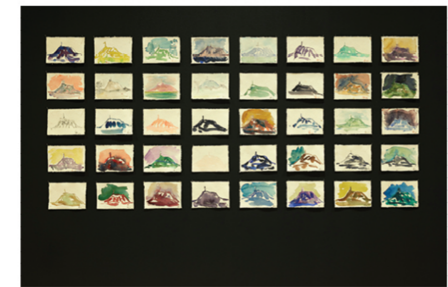
→ Puy-de-Dôme , 2020 aquarelle sur papier

et sur le parvis de la Gare de bordeaux Saint-Jean