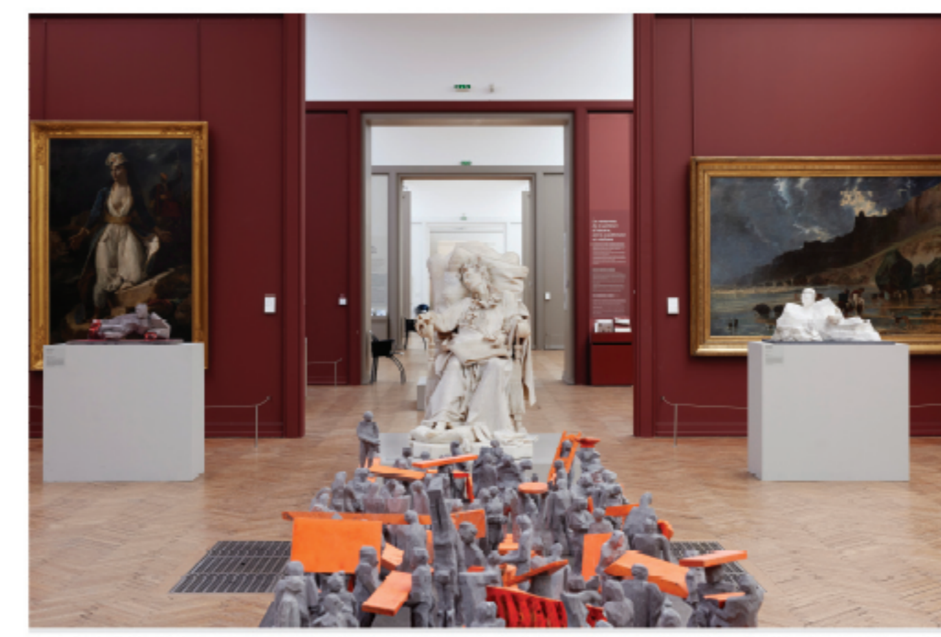
→ Individus X , 2015-2023 lave du Mont-Dore polychrome