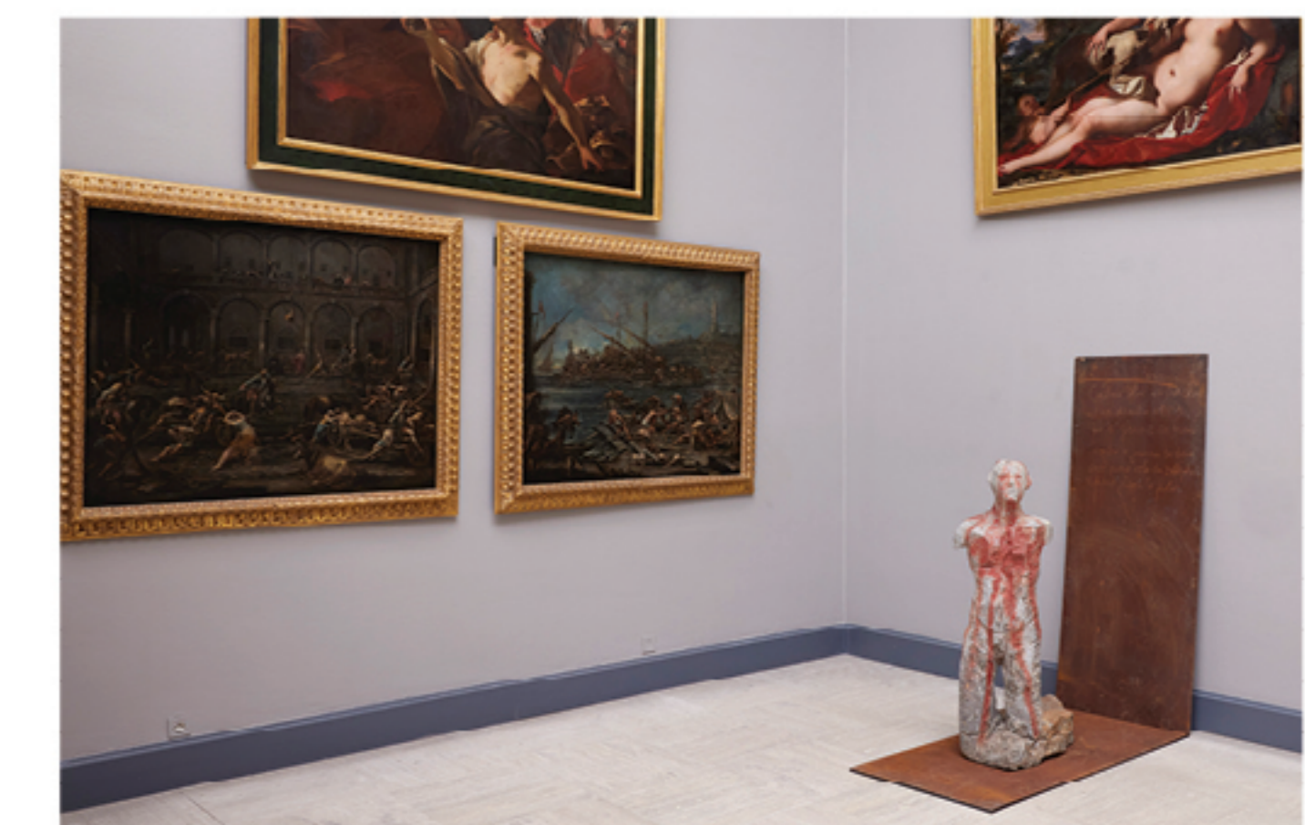
→ L'Exécuté , 2007 granit polychrome et acier