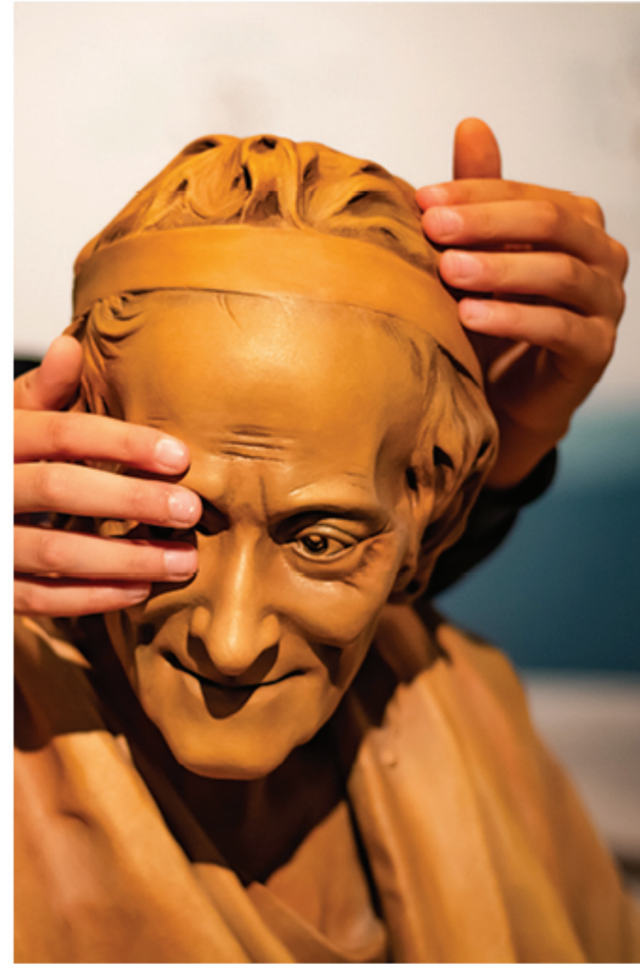
→ Prière de toucher! Jean-Antoine Houdon, Voltaire assis , vers 1780-1790, reproduction en résine patinée