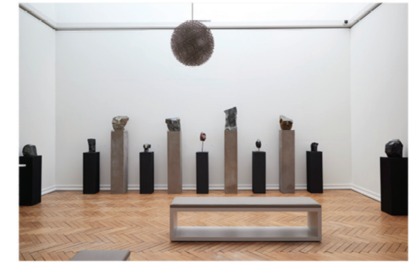
→ Torses , 2014-2019, diorite et Heaumes , 2018-2022, orgue basaltique, acier et bois

et sur le parvis de la Gare de bordeaux Saint-Jean