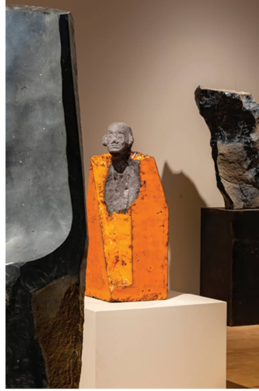
→ Denis Monfleur. Peuples de pierre. Moine bouddhiste , 2018, lave de Chambois émaillée