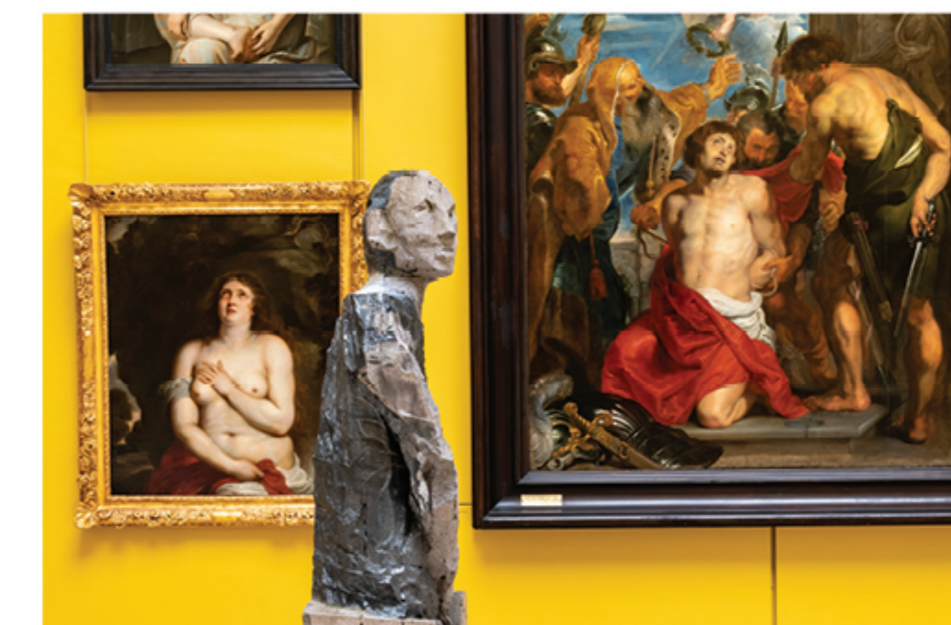
→ Saint Georges , 2022 lave de Chambois émaillée et gravée