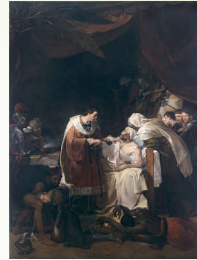
Guillaume Guillon-Lethière, Saint Louis visitant les pestiférés dans les plaines de Carthage , 1822, Huile sur toile

Sébastien, centurion romain, est au début du 4 ème siècle, percé de flèches sur ordre de l'empereur Dioclétien pour ne pas avoir abjuré sa foi chrétienne. Venues pour l'ensevelir, Irène, veuve chrétienne, et sa servante le trouvent encore vivant et le soignent. Rétabli, Saint Sébastien se présente devant l'empereur et lui reproche sa cruauté envers les chrétiens. Dioclétien le fait arrêter, battre à mort et jeter dans la Cloaca Maxima, le grand égout de Rome.