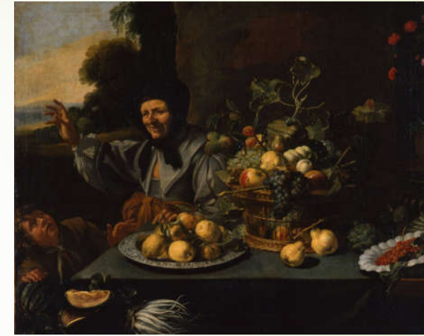
Pierre Van Boucle XVII ème , Une vieille femme défendant son étal de fruits à un jeune charpenteur , Huile sur toile

Un garde-manger est une armoire très finement grillagée permettant de mettre les aliments à l'abri des insectes ou des animaux tels que les chats, les oiseaux, les rongeurs, les lézards, etc. sans toutefois être stockés dans une atmosphère confinée.