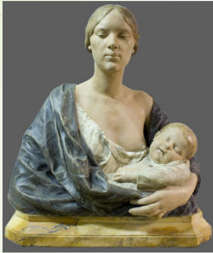
Gaston Laroux-Veunevot, Maternité , 1898, Ronde-bosse en pierre polychrome sur socle en marbre jaune