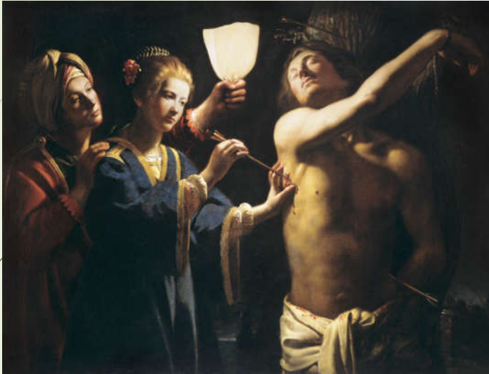
Maître à la chandelle, Saint Sébastien soigné par Irène , XVII ème . Huile sur toile