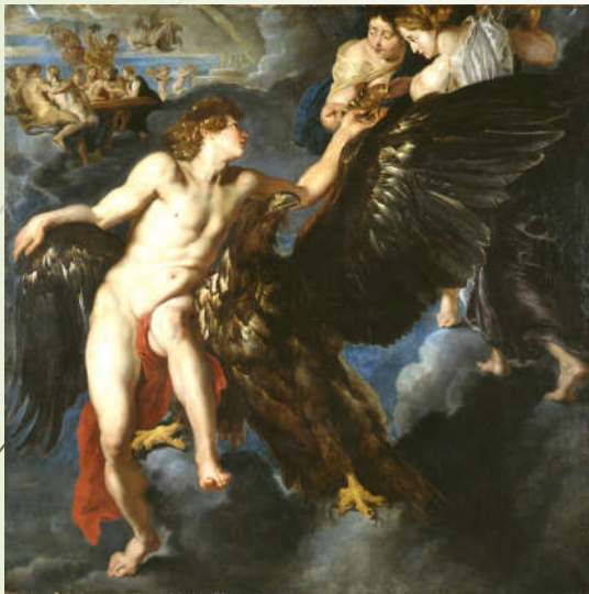
D'après Pierre Paul Rubens (1577-1640), L'Enlèvement de Ganymède , Huile sur toile