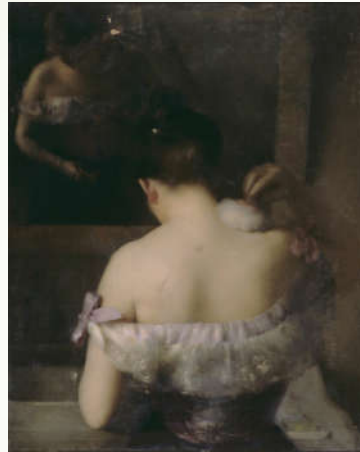
Etienne Tournès, La Houppe , 1857, Huile sur toile