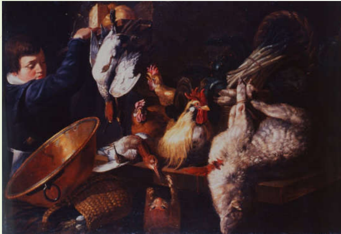
Giacomo Legi, Jeune homme dans un garde-manger , XVII ème , Huile sur toile