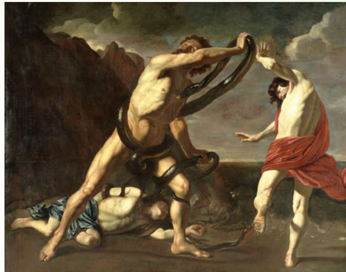
Pieter Claesz Soutman, Laocoon et ses fils mordus par les serpents , XVII ème Huile sur toile