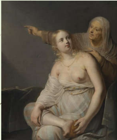
Pieter Frantz de Grebber, Bethsabée au bain , XVII ème Huile sur toile