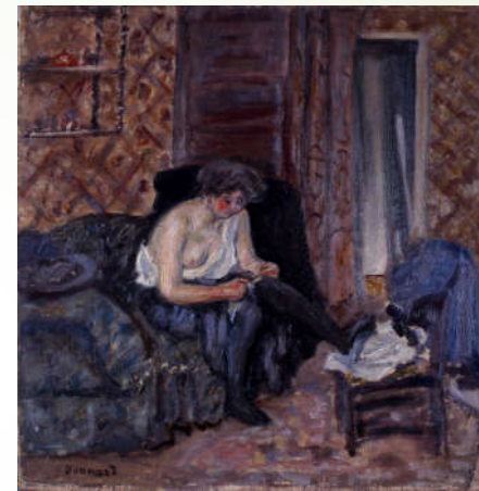
Pierre Bonnard, Les Bas noirs , 1899 Huile sur toile