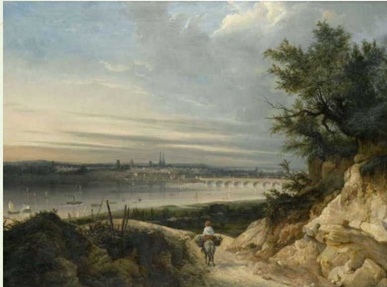
Jean-Paul Alaux, Vue de Bordeaux prise de Floirac , 1832, Huile sur toile