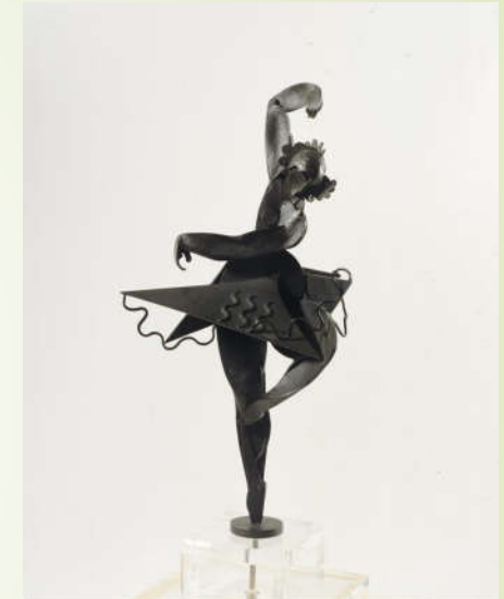
Pablo Gargallo, Danseuse , 1925 Ronde-bosse en cuivre patiné

Les thèmes mythologiques servent souvent de prétexte aux peintres pour représenter des corps dénudés. Pieter Claesz Soutman peint des corps en mouvement le long de lignes obliques. Le Ganymède de Rubens est allongé, assis sur l'aile de l'aigle amoureux (Zeus) qui l'a enlevé. Sa position est complexe. L'artiste baroque le peint avec une palette de couleurs vives, technique qui l'a rendu célèbre. La sculpture cubiste de Pablo Gargallo représente sans doute une danseuse des Ballets russes de Serge de Diaghilev.