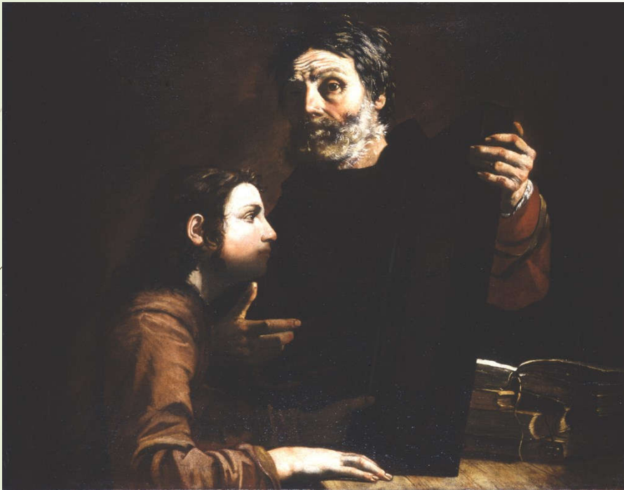
Giovanni Do, Un maître et son élève , XVII ème , Huile sur toile

Ce tableau serait une illustration du "Connais-toi toi-même" de Socrate et c'est la raison pour laquelle le maître présente à son élève un miroir, afin qu'il commence sa formation par l'étude de sa personnalité.